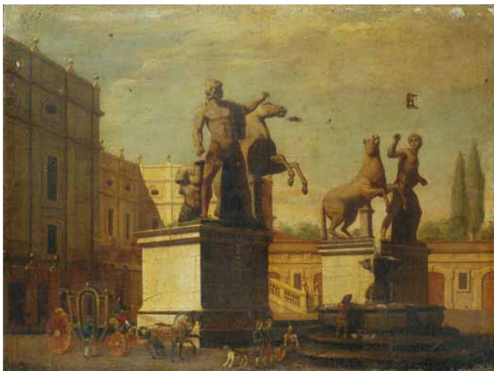
263 (uno di due)