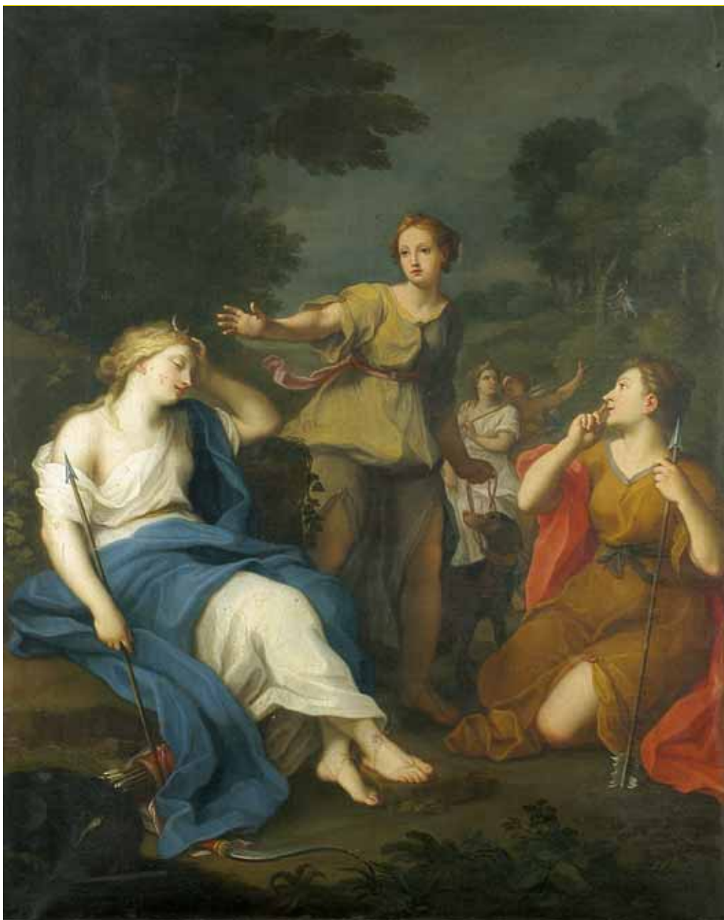
220 Marcantonio Franceschini (1648-1729) Diana cacciatrice olio su tela, cm 150x120, in cornice dorata € 60.000-80.000