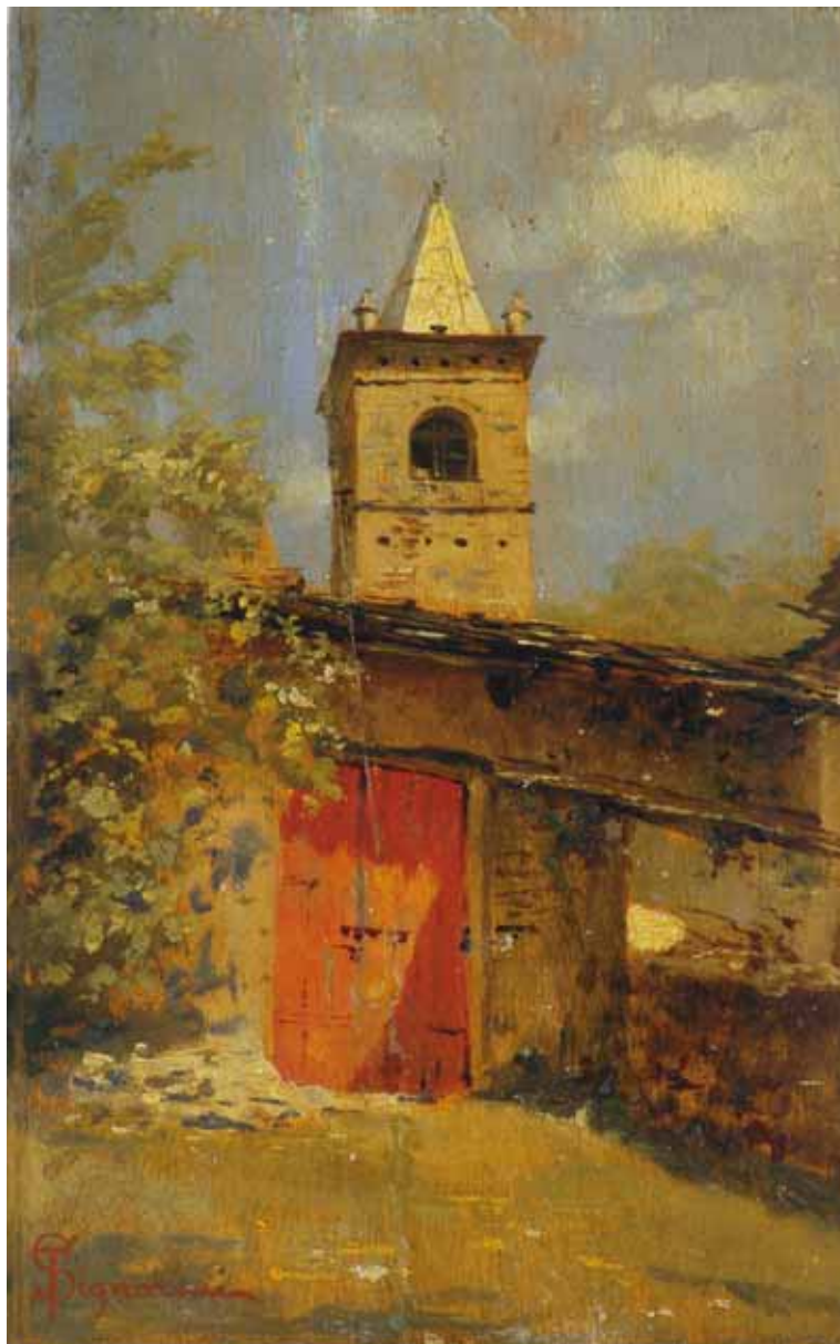
304 (dimensioni reali)

La chiesetta olio su tavoletta, cm 16x10, in cornice dorata Sul retro etichetta della Galleria Bolzani di Milano, Mostra dell'800 del 28-02-1942, n° 61 con indicazioni dei vecchi proprietari. Autentica scritta sulla tavoletta del 1948 di Franchi (?) € 6.500-7.500