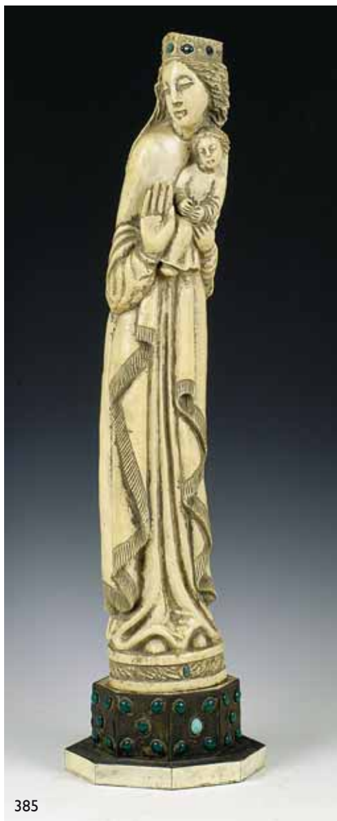
385 Madonna con Bambino Gesù in avorio e pietre incastonate, altezza cm 80 € 6.000-8.000